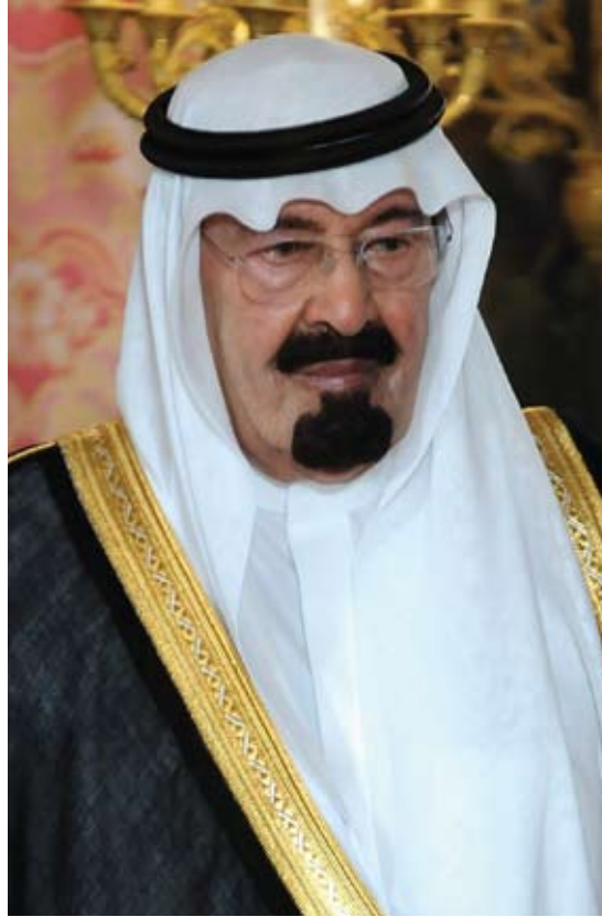
ملك المملكة العربية السعودية رئيس مجلس الوزراء القائد الأعلى للقوات المسلحة