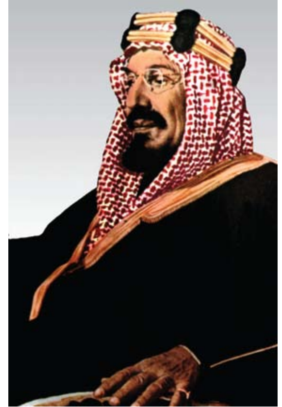
الملك المؤسس عبد العزيز بن عبد الرحمن آل سعود