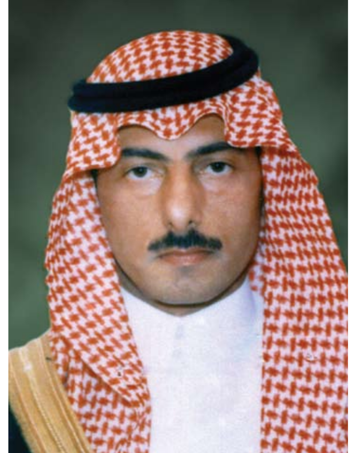
المدير التنفيذي لجمعية البيئة السعودية

صاحب السمو الملكي الأمير نواف بن ناصر بن عبد العزيز آل سعود