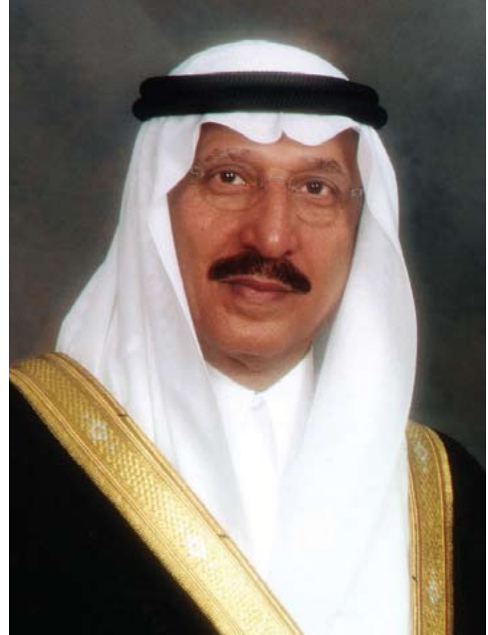
الرئيس الفخري لجمعية البيئة السعودية – فرع جازان