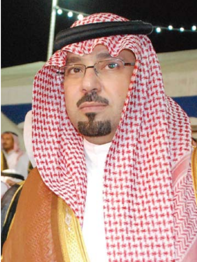
الرئيس الفخري لجمعية البيئة السعودية – فرع نجران