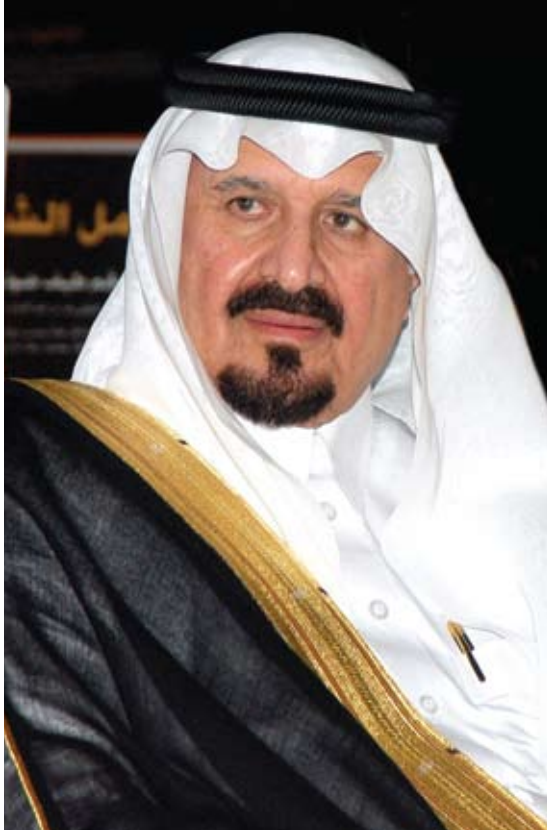
ولي العهد ونائب رئيس مجلس الوزراء و وزير الدفاع والطيران والمفتش العام